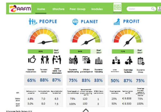
CSR manager als rapportagetool